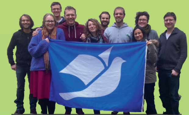
l'équipe de la campagne internationale de la Journée de Libération des Documents